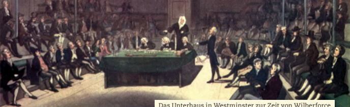
Das Unterhaus in Westminster zur Zeit von Wilberforce