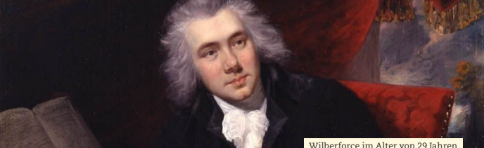
Wilberforce im Alter von 29 Jahren