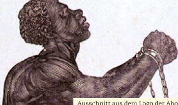
Ausschnitt aus dem Logo der Abolitionisten

Heute ist Sklaverei verboten. Die Rechte aller Menschen sind persönlich und völkerrechtlich geschützt. 1948 verabschiedeten die Vereinten Nationen die Allgemeine Erklärung der Menschenrechte. Artikel 4 lautet: »Niemand darf in Sklaverei oder Leibeigenschaft gehalten werden; Sklaverei und Sklavenhandel in allen ihren Formen sind verboten.« 1980 hat Mauretanien diese Erklärung als letztes Land der Erde unterschrieben.